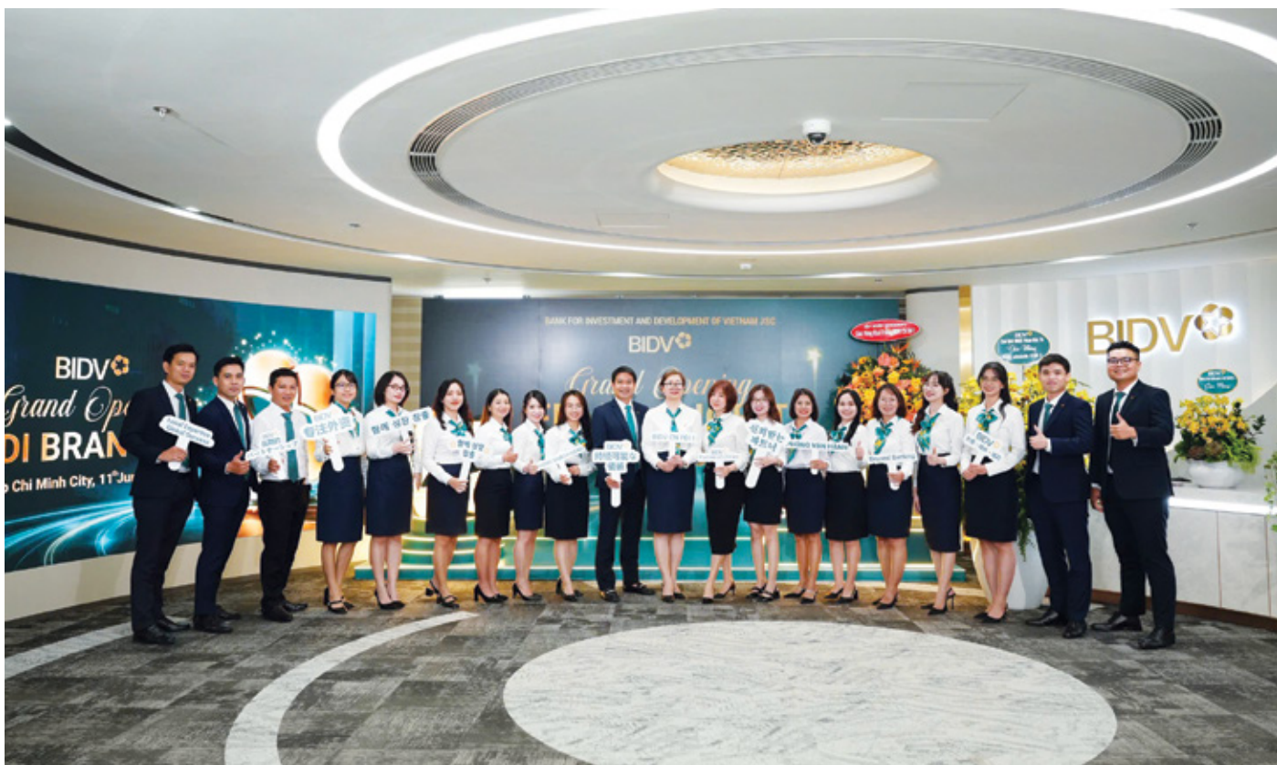
Tập thể Chi nhánh FDI I ngày khai trương hoạt động

Ngày 11/6/2026 tại TP. Hồ Chí Minh, Ngân hàng TMCP Đầu tư và Phát triển Việt Nam (BIDV) chính thức ra mắt Chi nhánh FDI I.