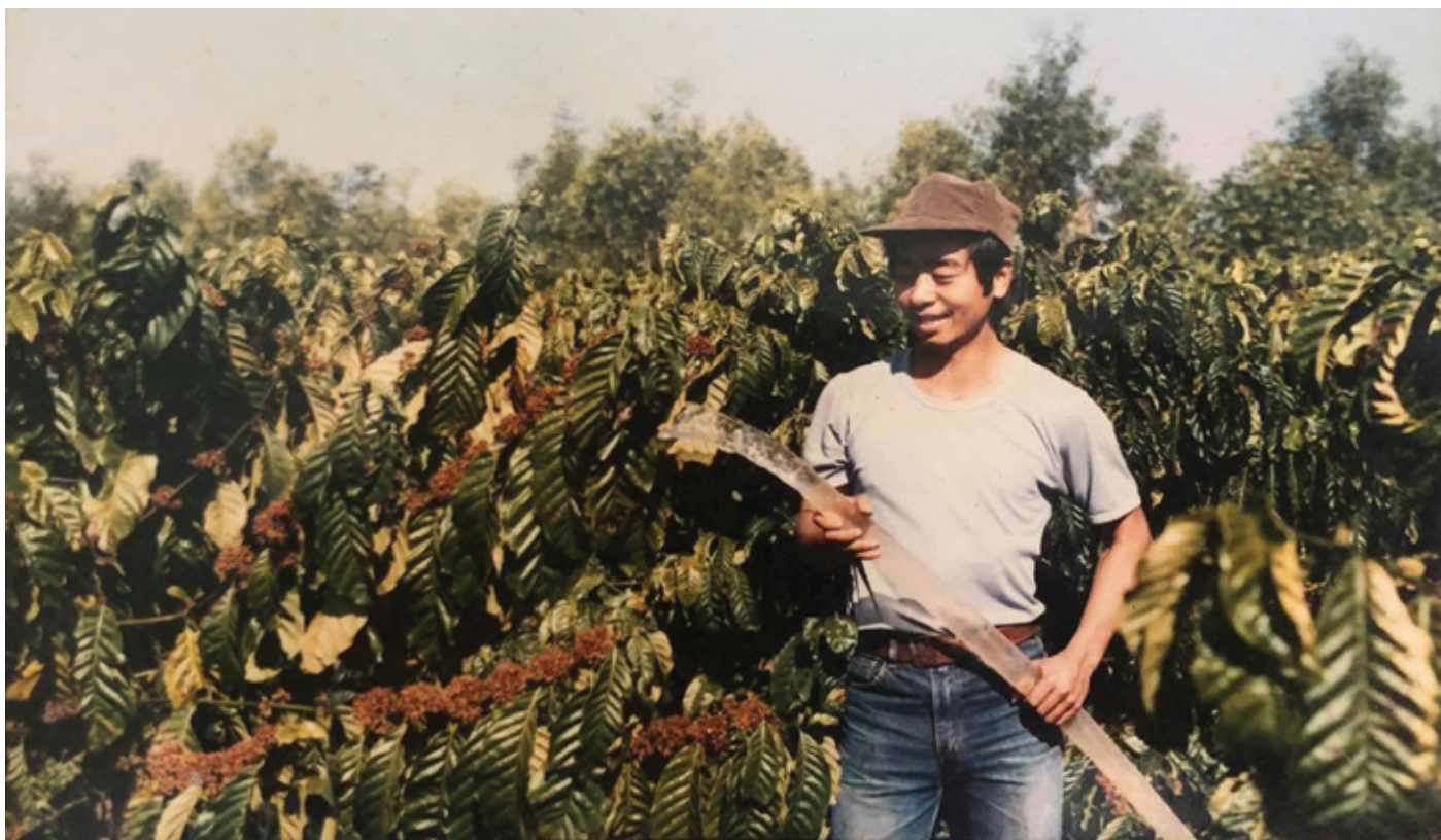
Tác giả tham gia chăm sóc vườn cà phê của chi nhánh

Phó Bí thư Thường trực Đảng ủy, UV HĐQT BIDV, Phó giám đốc Chi nhánh Gia Lai 1996 - 2006