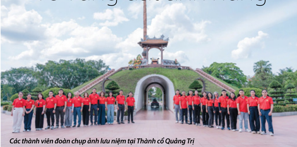
Các thành viên đoàn chụp ảnh lưu niệm tại Thành cổ Quảng Trị