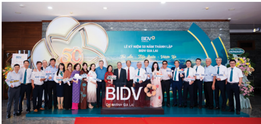
Các thế hệ cán bộ chi nhánh chụp ảnh lưu niệm nhân dịp kỷ niệm 50 năm thành lập