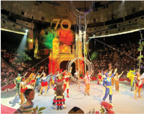
"Giấc mơ tuổi thần tiên" tại Rạp xiếc Trung ương cho con em cán bộ

Nhân dịp Ngày Quốc tế Thiếu nhi 1/6, các Chi nhánh, Trung tâm thuộc hệ thống BIDV trên cả nước đã đồng loạt tổ chức những chương trình ý nghĩa. Không chỉ dừng lại ở hoạt động vui chơi giải trí, chuỗi sự kiện còn là nhịp cầu lan tỏa các giá trị nhân văn, văn hóa "Nghĩa tình" đến cán bộ nhân viên.