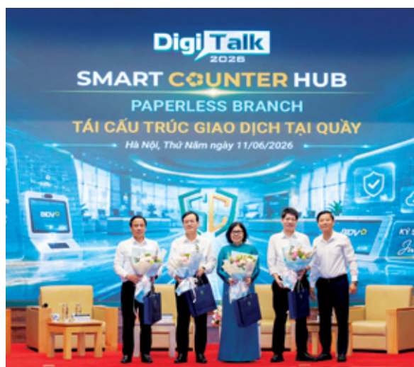
Các diễn giả chụp ảnh lưu niệm tại sự kiện

bước hiện thực hóa mô hình Quầy giao dịch thông minh - không giấy tờ trên toàn hệ thống.