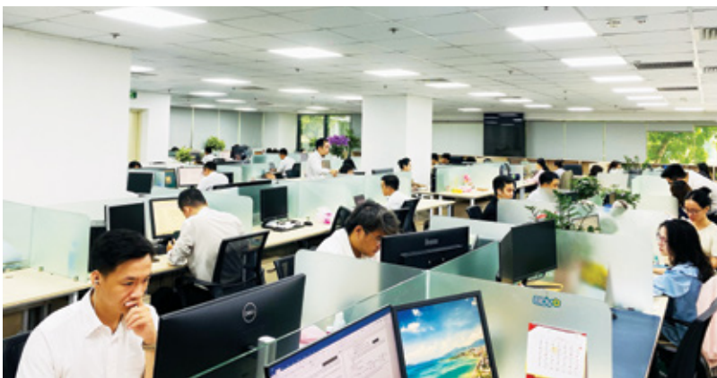
Tinh thần làm việc hăng say của các thành viên Ban Quản lý dự án Lending Hub

Vượt qua những ngày hè oi ả, tôi tin rằng sự nỗ lực hôm nay của tập thể Ban Quản lý dự án Lending Hub sẽ góp phần mang lại cho hệ thống những cánh mai vàng rực rỡ để chúng ta cùng tiếp bước phát triển bền vững trong những mùa xuân mới. □