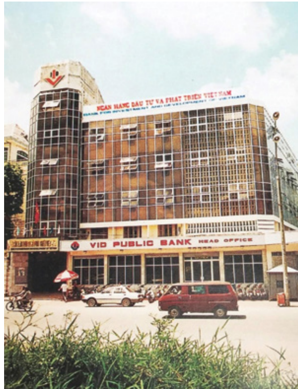
Tòa nhà trụ sở BIDV 194 Trần Quang Khải - 1995

Tình yêu Tổ quốc như thế - không hô hào, không phong trào - mới là loại tình yêu bền lâu nhất. Nó được sống mỗi ngày trong từng quyết