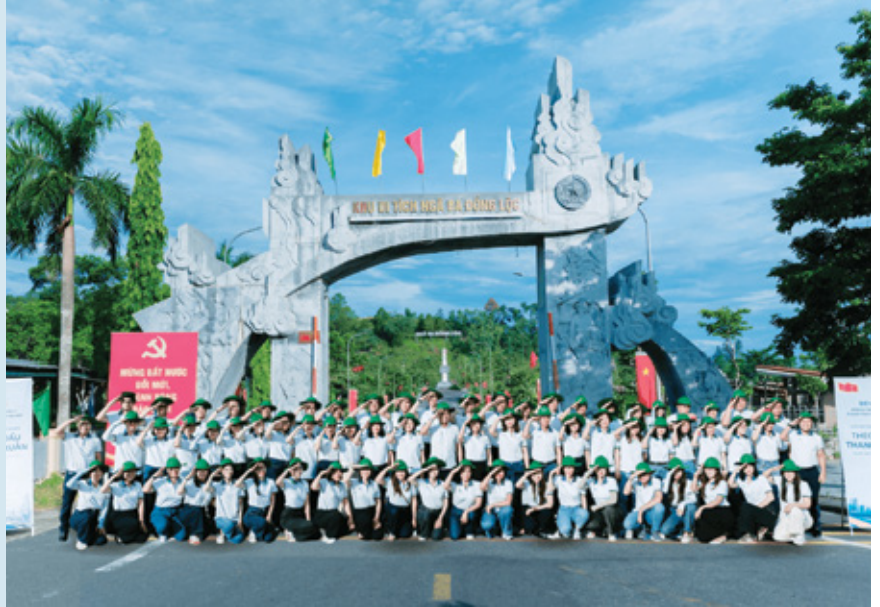
Hành trình tri ân “Theo dấu thanh xuân” của Đảng bộ Ban Quản lý Khách hàng doanh nghiệp tại Ngã ba Đồng Lộc

Vừa qua, Đảng bộ Ban Quản lý khách hàng doanh nghiệp phối hợp cùng Chi nhánh Hà Tĩnh tổ chức chuỗi hoạt động về nguồn và an sinh xã hội đầy ý nghĩa trên địa bàn tỉnh Hà Tĩnh. Đây không chỉ là cơ hội để các cán bộ ngân hàng ôn lại truyền thống lịch sử vẻ vang của dân tộc, mà còn là dịp để lan tỏa tinh thần trách nhiệm với cộng đồng, chung tay hỗ trợ cho sự nghiệp giáo dục tại vùng đất hiếu học còn nhiều gian khó.