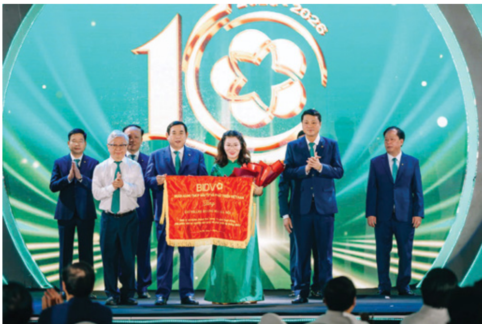
Ban lãnh đạo BIDV trao tặng cờ lưu niệm cho Chi nhánh Hoàng Mai Hà Nội ghi nhận những đóng góp tích cực cho hệ thống nhân dịp kỉ niệm 10 năm thành lập

xấu liên tục được kéo giảm, đến cuối năm 2025 chỉ còn 0,07% – thấp hơn rất nhiều mức bình quân cụm Hà Nội (0,5%), đưa chi nhánh vào nhóm quản trị rủi ro tốt nhất hệ thống.