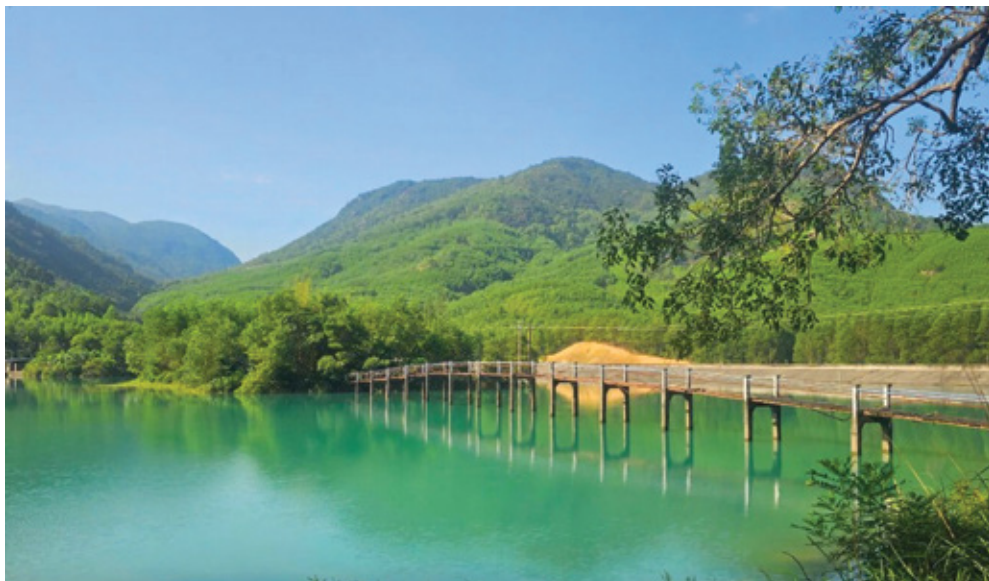
Hồ thủy điện Duy Sơn 2

Trong nhiều câu chuyện về nghĩa tình của tập hồi ký, có một chuyện