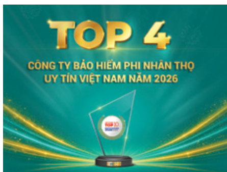
BIC lọt Top 4 Công ty Bảo hiểm Phi nhân thọ uy tín Việt Nam năm 2026

Năm 2025 có nhiều khó khăn của thị trường bảo hiểm phi nhân thọ Việt Nam, song BIC vẫn tiếp tục ghi dấu ấn với nền tảng hoạt động bền vững và hướng tới khách hàng.