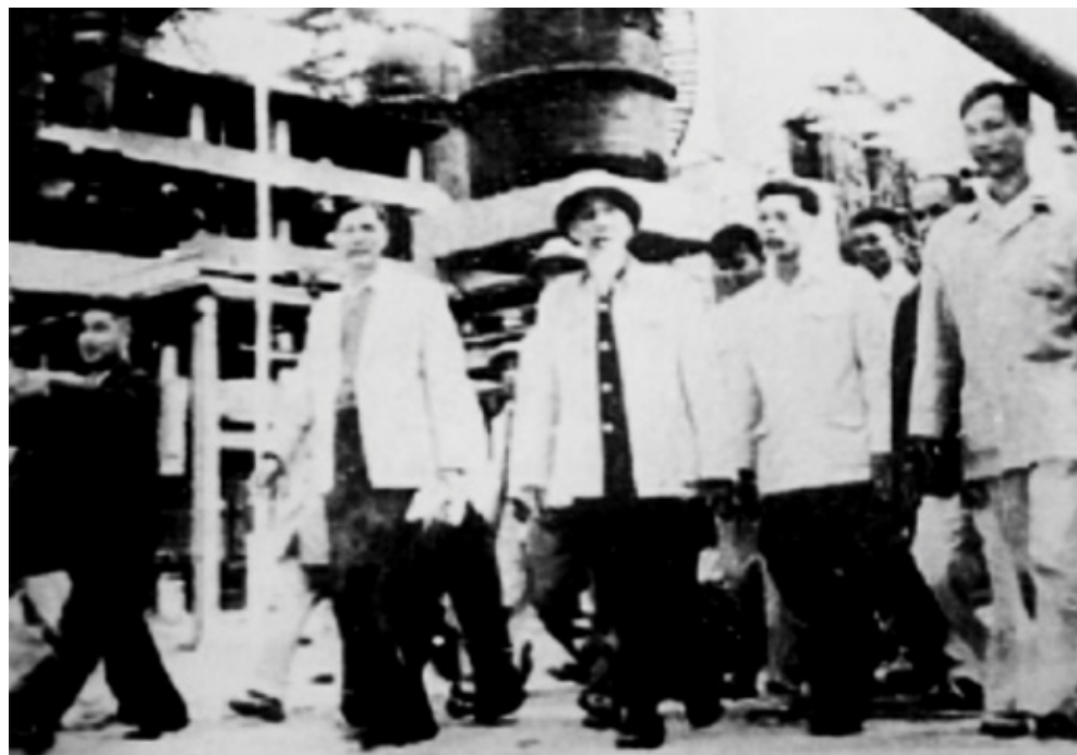
Chủ tịch Hồ Chí Minh về thăm Khu gang thép Thái Nguyên 1964 - công trình trọng điểm NH Kiến thiết cấp phát vốn

Trong tất cả các biểu hiện của nghĩa tình BIDV, có một mạch cao cả nhất, sâu xa nhất và cũng ít được nói đến nhất: đó là tình yêu Tổ quốc.