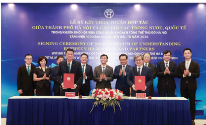
BIDV cam kết đồng hành cùng TP. Hà Nội thúc đẩy kinh tế số và xã hội số