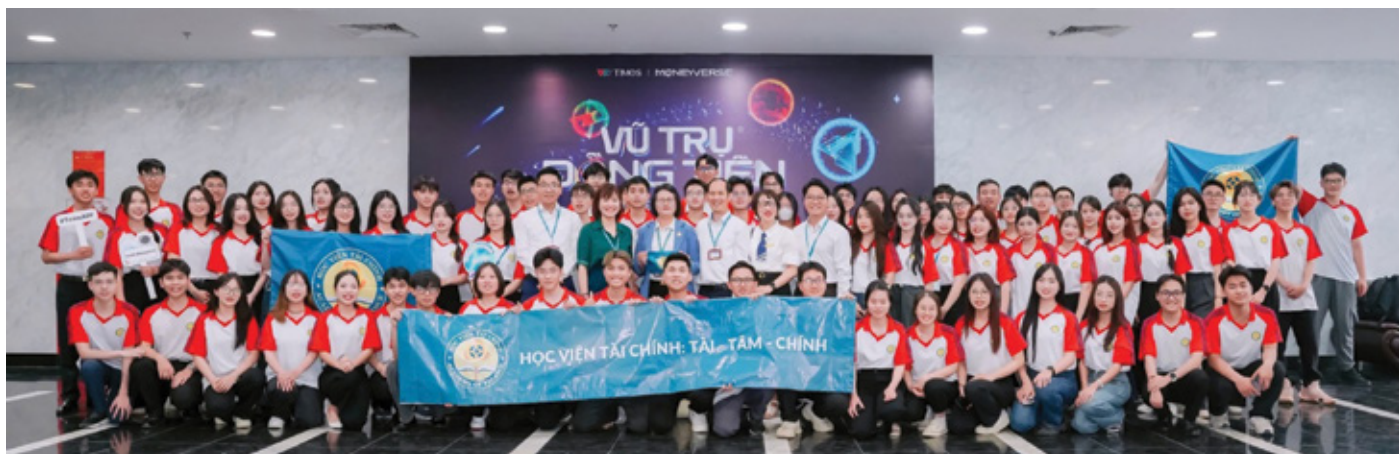
Sinh viên Học Viện tài chính luôn nhiệt huyết và cống hiến hết mình với những sân chơi học thuật như Moneyverse

Là ngôi trường đầu tiên đăng ký tham gia "Vũ trụ đồng tiền" từ mùa 1, với hai mùa liên tiếp có sinh viên lọt vào Top 6, Học viện Tài chính khẳng định là cái nôi cung cấp nguồn nhân lực chất lượng cao lĩnh vực Kinh tế - Tài chính