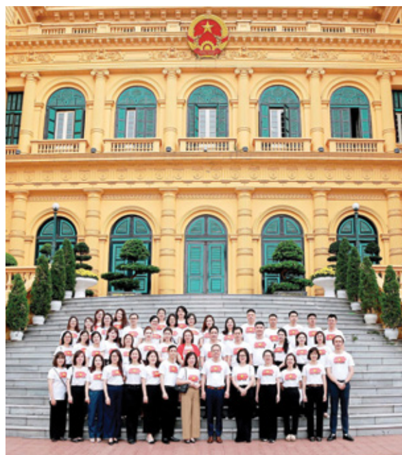
Đoàn cán bộ, đảng viên Trường Đào tạo Cán bộ BIDV chụp ảnh lưu niệm trong buổi sinh hoạt chính trị

Đi qua nhà sàn, nhà số 54 và nhà 67, chúng tôi càng cảm nhận rõ hơn phong cách sống giản dị của Người. Ngôi nhà sàn trong Phủ Chủ tịch – nơi Bác sống từ năm 1958 đến 1969 – được xây bằng gỗ mộc mạc, chỉ có hai tầng, với rất ít đồ đạc: một chiếc giường, một bàn làm việc và một giá sách. Nhà 54 – nơi Bác ở từ năm 1954 đến 1958 – nhỏ bé với hai phòng đơn sơ, bàn ghế gỗ mộc và một bếp nhỏ. Nhà 67 – nơi Người làm việc và nghỉ ngơi khi sức khỏe yếu – lại càng giản dị hơn: một bộ bàn ghế làm việc, một chiếc giường