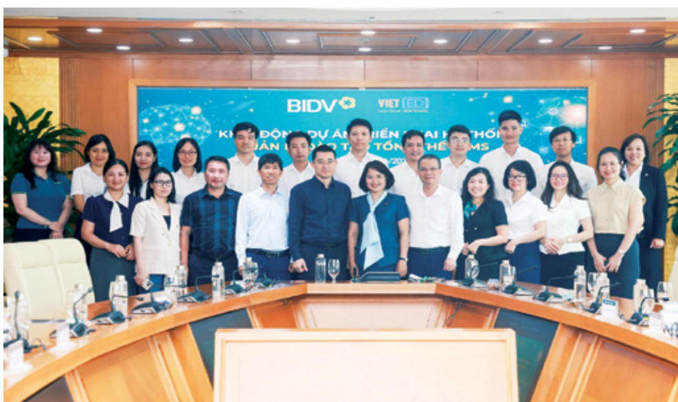
Đại diện lãnh đạo BIDV, lãnh đạo và cán bộ các đơn vị cùng đối tác VietED chụp ảnh lưu niệm tại chương trình