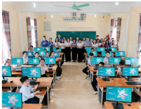
Ban Quản lý khách hàng doanh nghiệp cùng BIDV Hà Tĩnh trao tặng 20 bộ máy tính cho các em học sinh trường THCS Sơn Tây

Thấu hiểu những trăn trở đó, chương trình “Trao máy tính – Gửi tương lai” đã mang đến những món quà vô cùng thiết thực. Tại đây, Ban Quản lý khách hàng doanh nghiệp cùng BIDV Hà Tĩnh đã trao tặng một phòng học tin học hiện đại với quy