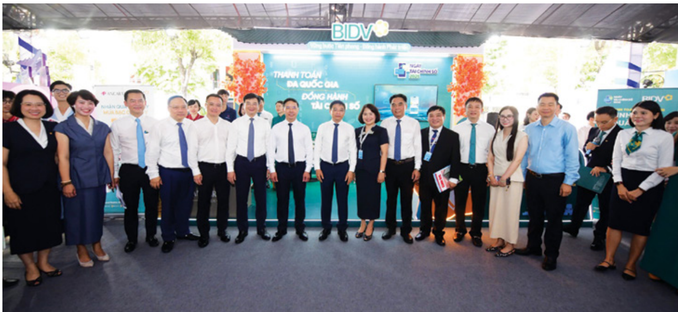
Phó Thủ tướng Chính phủ Nguyễn Văn Thắng, Thống đốc NHNN Phạm Đức Ấn, Phó Thống đốc NHNN Phạm Thanh Hà và lãnh đạo UBND TP. Hồ Chí Minh đến thăm gian trưng bày ấn tượng của BIDV

Sáng 6/6, tại TP. Hồ Chí Minh đã diễn ra sự kiện Lễ hội Tài chính số 2026 và Hội thảo “Thanh toán thông minh trong kỷ nguyên số”