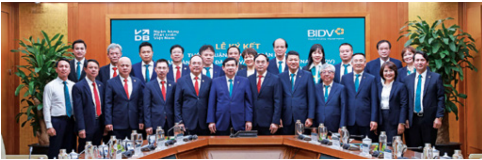
Đại diện lãnh đạo hai Ngân hàng chụp ảnh lưu niệm tại Lễ ký kết

Theo thỏa thuận, BIDV và VDB sẽ phát huy thế mạnh bổ trợ của mỗi bên, tăng cường phối hợp trong các lĩnh vực trọng tâm như cấp tín dụng và đồng tài trợ dự án, nguồn vốn và kinh doanh tiền tệ, thanh toán trong nước và quốc tế, tài trợ thương mại, quản lý dòng tiền, tài chính xanh, ngân hàng số và các dịch vụ tài chính hiện đại. Sự hợp tác giữa hai bên được xây dựng trên nền tảng cộng hưởng thế mạnh của BIDV – ngân hàng thương mại có mạng lưới rộng khắp, nền tảng công nghệ và hệ sinh thái dịch vụ tài chính đa dạng – với VDB, ngân hàng chính sách của Nhà nước giữ vai trò quan trọng trong thực hiện tín dụng đầu tư phát triển và tín dụng xuất khẩu của Nhà nước. Bên cạnh đó, hai ngân hàng sẽ tăng cường hợp tác trong các lĩnh vực tiềm năng như tài chính bền vững, bán chéo sản phẩm, dịch vụ ngân hàng bán lẻ, dịch vụ bảo