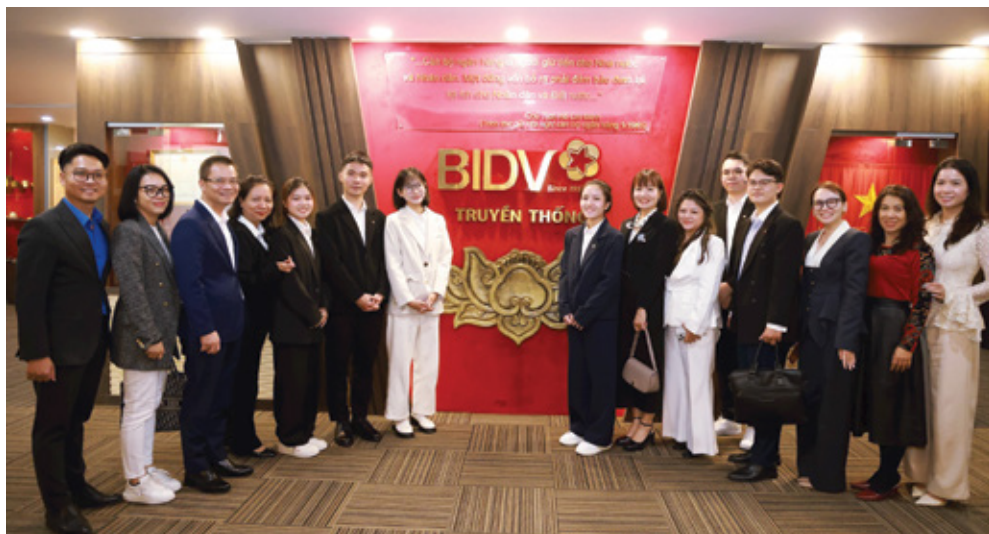
Các thí sinh The Moneyverse tham quan Phòng Truyền thống BIDV

nguồn lực tài chính, mà còn là sự hiện diện của con người, của tri thức, của kinh nghiệm thực tiễn và trên hết là tinh thần trách nhiệm cùng sự đầu đầu, tình cảm chân thật dành cho thế hệ trẻ.