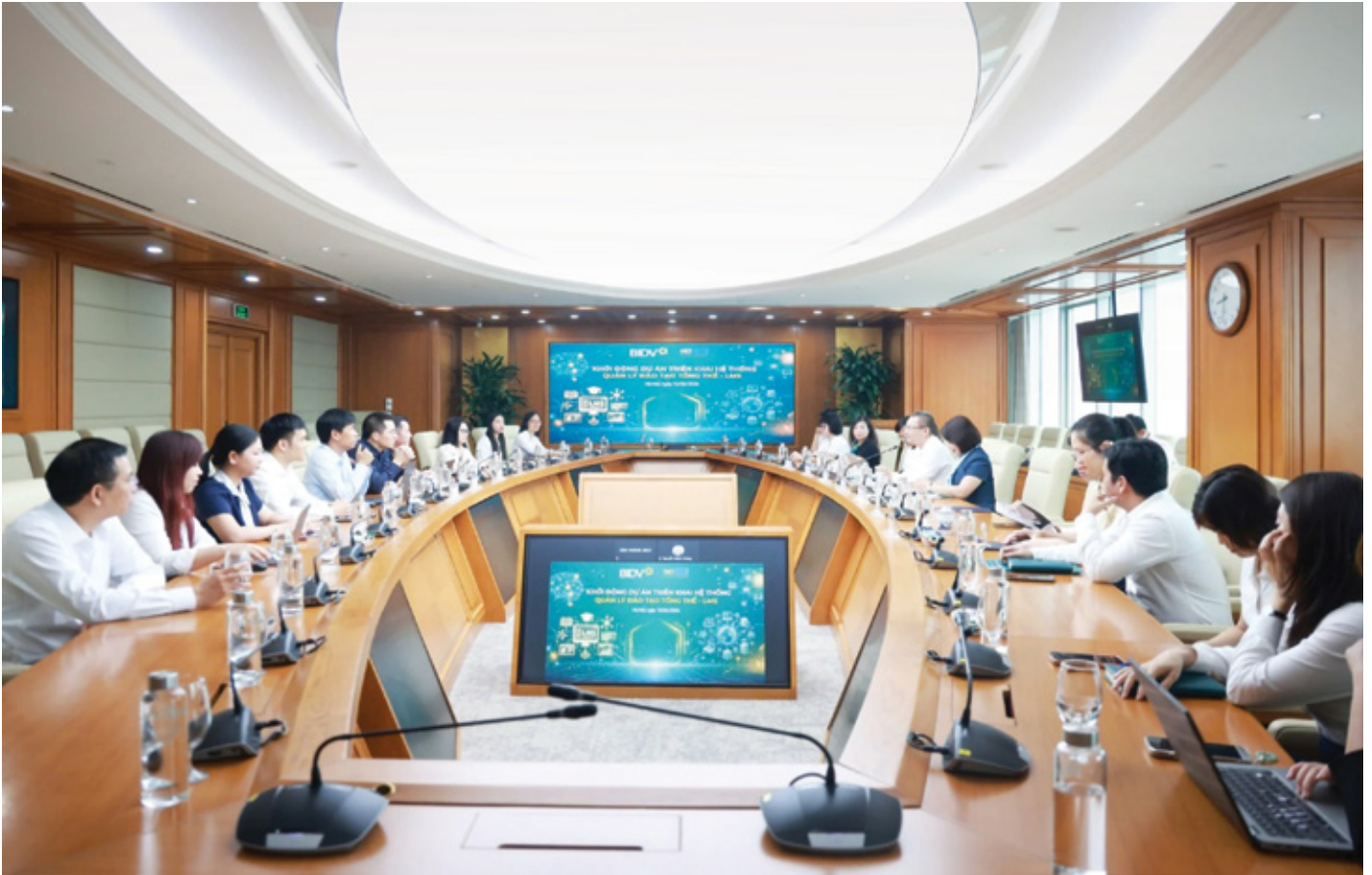
Toàn cảnh Lễ khởi động Dự án “Mua sắm hệ thống quản lý đào tạo tổng thể - LMS”

Ngày 10/6/2026, tại Tháp BIDV (194 Trần Quang Khải, Hà Nội), Ngân hàng TMCP Đầu tư và Phát triển Việt Nam (BIDV) và Công ty Cổ phần Công nghệ Giáo dục Thông minh (VietED) đã tổ chức Lễ khởi động Dự án “Mua sắm hệ thống quản lý đào tạo tổng thể - LMS”, đánh dấu bước khởi đầu quan trọng trong hành trình chuyển đổi số công tác đào tạo và phát triển nguồn nhân lực của BIDV.