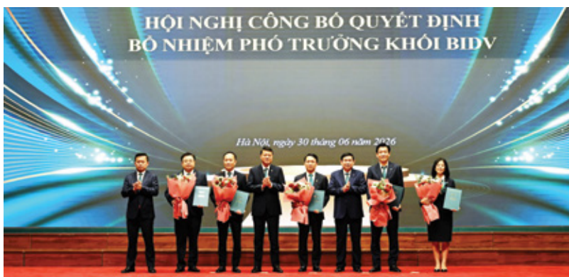
Ban lãnh đạo trao quyết định bổ nhiệm các Phó Trưởng khối tại hội nghị

ngoài ngân hàng thương mại; Chiến lược phát triển bền vững và thực hành ESG tổng thể tại BIDV.