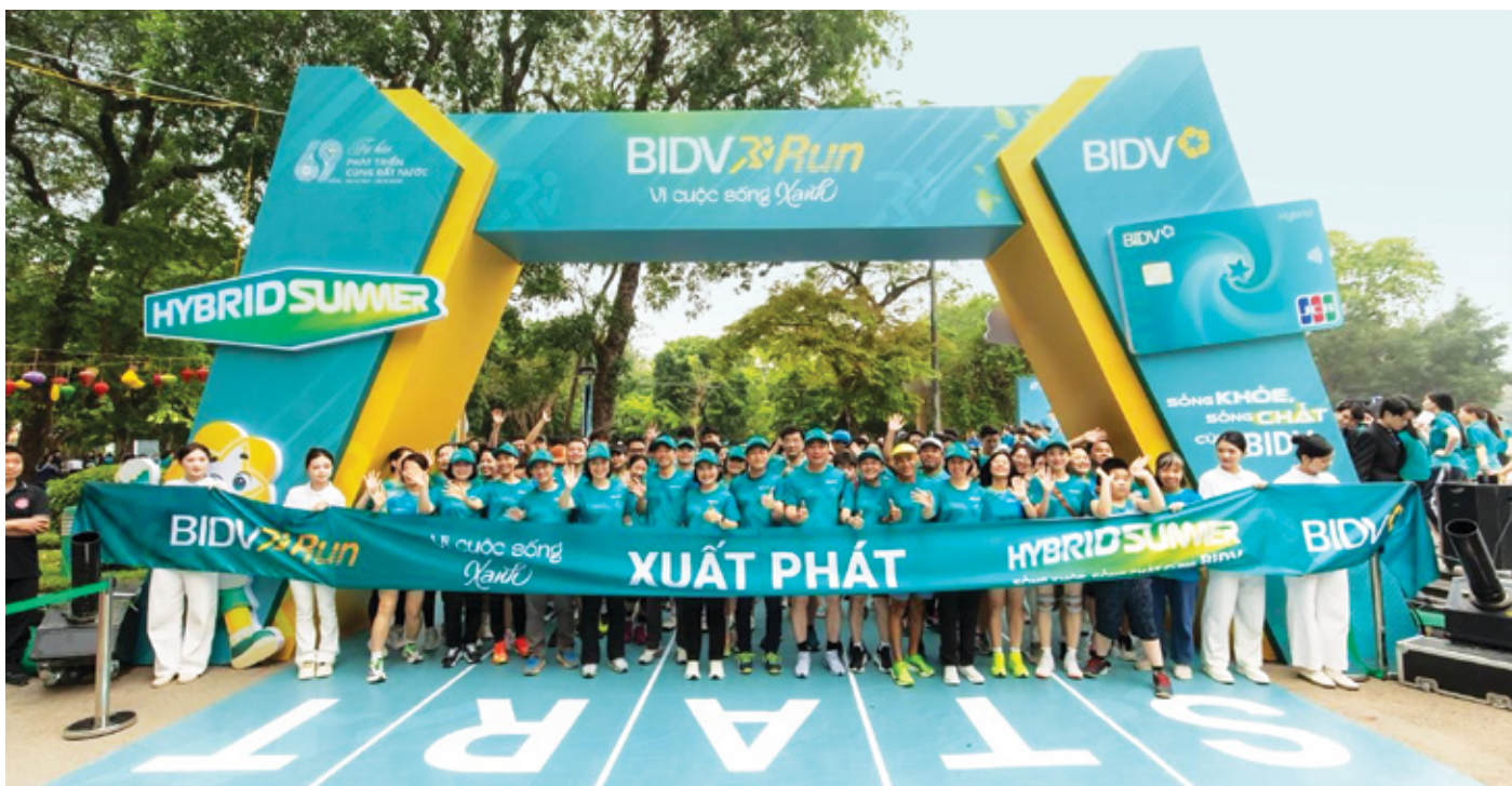
Song song với mục tiêu kinh doanh, BIDV luôn hướng đến các hoạt động mang lại hạnh phúc cho người lao động, cộng đồng và xã hội

một chiến lược phát triển bền vững thay vì một chương trình phúc lợi đơn lẻ.