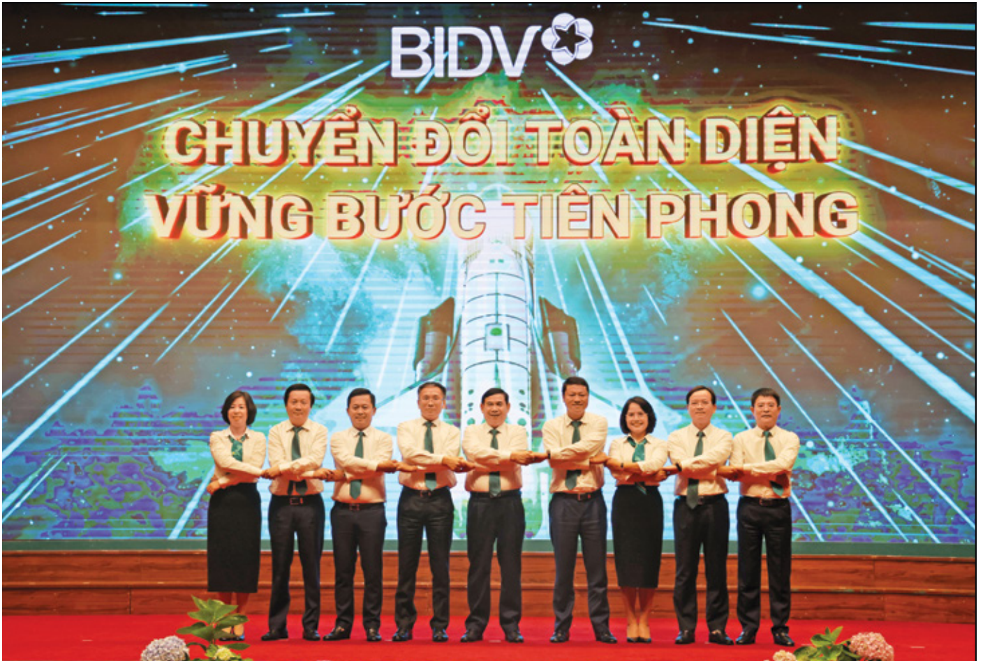
Dưới sự chỉ đạo sát sao và định hướng chiến lược của Chủ tịch Phan Đức Tú, hoạt động ngân hàng bán lẻ BIDV đã có bước chuyển đổi mạnh mẽ, toàn diện

Những kết quả nổi trội của BIDV thời gian qua đã được cộng đồng quốc tế ghi nhận: BIDV vào Top 1.000 công ty đại chúng lớn nhất thế giới (theo Forbes), Top 200 thương hiệu ngân hàng giá trị nhất toàn cầu (theo Brand Finance), Top 50 doanh nghiệp lớn nhất Đông Nam Á và dẫn đầu ngành ngân hàng Việt Nam (theo Fortune Southeast Asia 500).