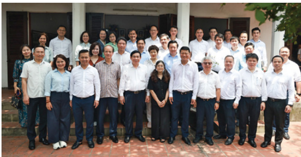
Đoàn BIDV đến thăm và thắp hương tại nhà tưởng niệm Phó Thủ tướng Phan Kế Toại - người kí quyết định số 177/TTg thành lập Ngân hàng Kiến thiết Việt Nam ngày 26/4/1957