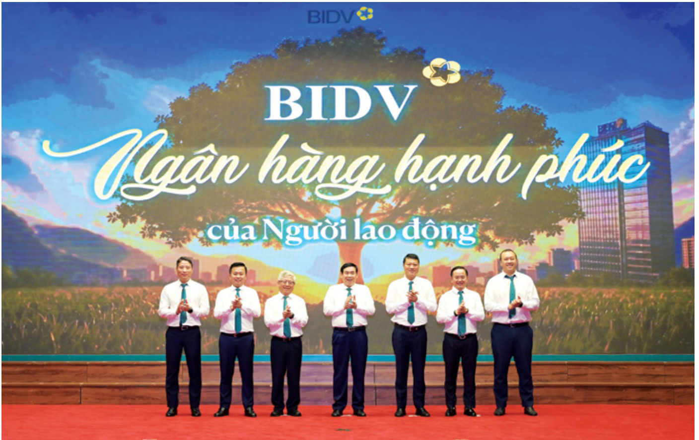
Đại diện Ban lãnh đạo và Bí thư Đoàn Thanh niên BIDV tại Lễ ra mắt và triển khai đề án "Xây dựng BIDV là Ngân hàng Hạnh phúc của Người lao động"

Ngân hàng TMCP Đầu tư và Phát triển Việt Nam (BIDV) chính thức triển khai Đề án "Xây dựng BIDV là Ngân hàng Hạnh phúc của Người lao động" từ tháng 6/2026, đánh dấu bước tiến mới trong chiến lược phát triển nguồn nhân lực và củng cố văn hóa doanh nghiệp lấy con người làm trung tâm.