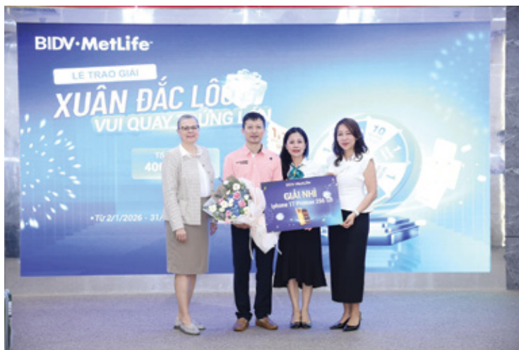
BIDV MetLife triển khai hoạt động trao thưởng chương trình “Xuân Đắc Lộc - Vui quay trúng lớn”

Vừa qua, BIDV MetLife đã triển khai hoạt động trao thưởng chương trình “Xuân Đắc Lộc - Vui quay trúng lớn” tại nhiều địa phương trên cả nước. Đây là một trong những hoạt động tri ân dành cho khách hàng tái tục, thể hiện sự trân trọng của doanh nghiệp đối với những khách hàng đã tiếp tục lựa chọn BIDV MetLife là người bạn đồng hành trong kế hoạch bảo vệ bản thân và gia đình.