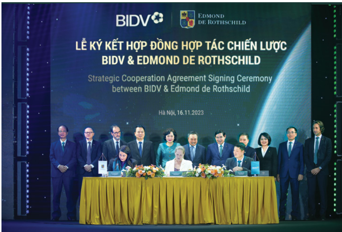
Giai đoạn 2018 -2026, BIDV tiếp tục xây dựng nhiều quan hệ hợp tác chiến lược quan trọng với các đối tác trong nước và quốc tế

tạo dựng và củng cố lòng tin của các cấp lãnh đạo Đảng, Nhà nước và Chính phủ đối với BIDV, đồng thời nâng cao uy tín của ngân hàng với các đối tác và định chế tài chính quốc tế.