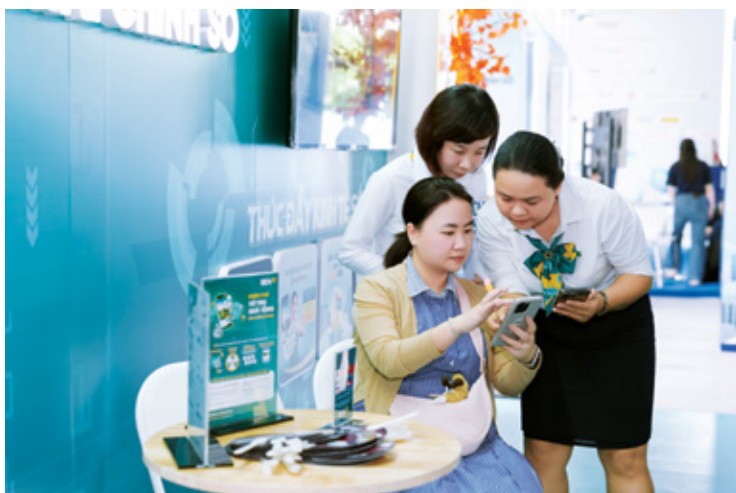
Khách hàng trực tiếp trải nghiệm các giải pháp thanh toán mới