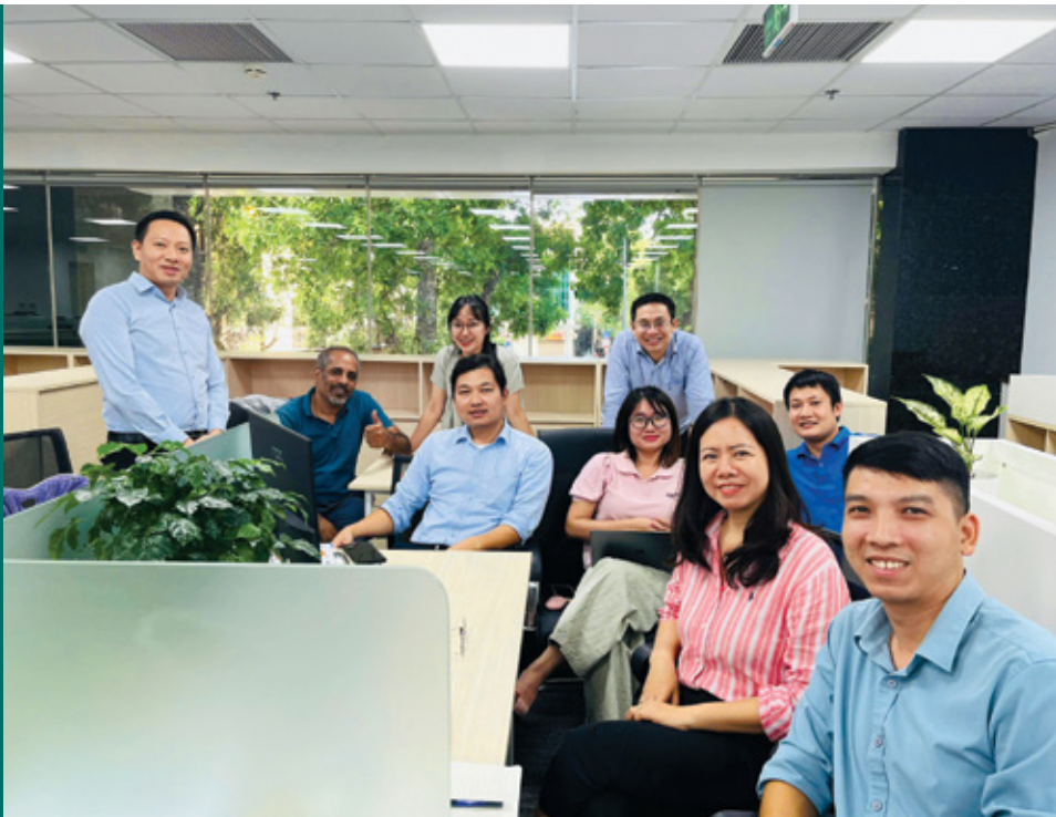
Các thành viên tham gia Ban Quản lý dự án Lending Hub

Những ngày đầu tháng Sáu, Hà Nội như một "chảo lửa" thực sự. Hơi nóng hầm hập phả qua từng ô cửa kính cũng không làm giảm đi không khí khẩn trương, đặc quánh sự tập trung tại văn phòng làm việc của Ban Quản lý dự án Lending Hub. Tiếng gõ phím lạch cạch, tiếng trao đổi nghiệp vụ râm ran và những cuộc họp chớp nhoáng nối tiếp nhau.