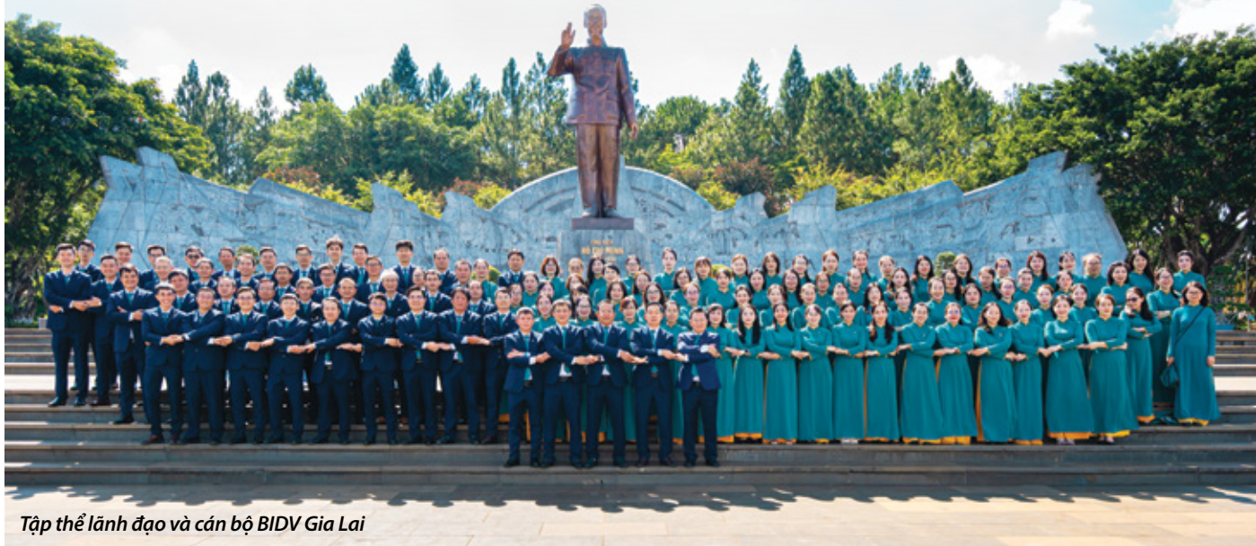
Tập thể lãnh đạo và cán bộ BIDV Gia Lai