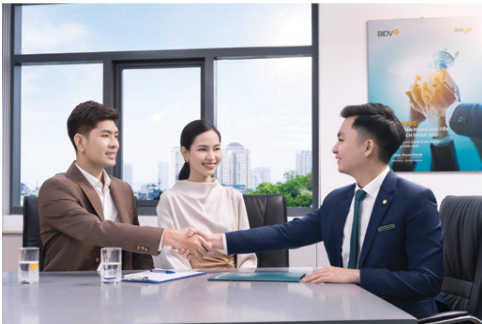
Mỗi cán bộ BIDV là một đại sứ thương hiệu, góp phần củng cố niềm tin của khách hàng

uy tín và bằng những giá trị của tổ chức được tổ chức và những con người trong tổ chức đó thực hành một cách nhất quán.