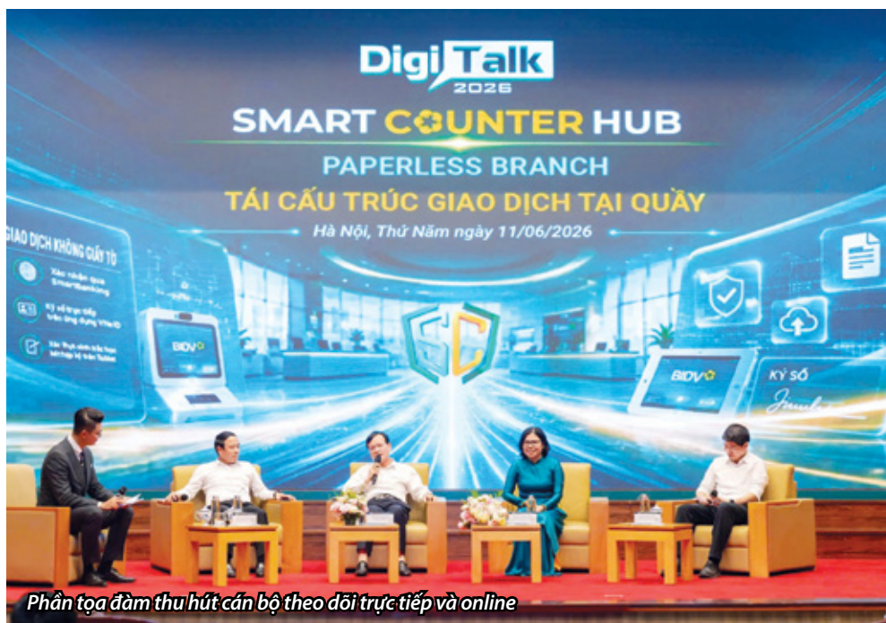
Phân tọa đàm thu hút cán bộ theo dõi trực tiếp và online