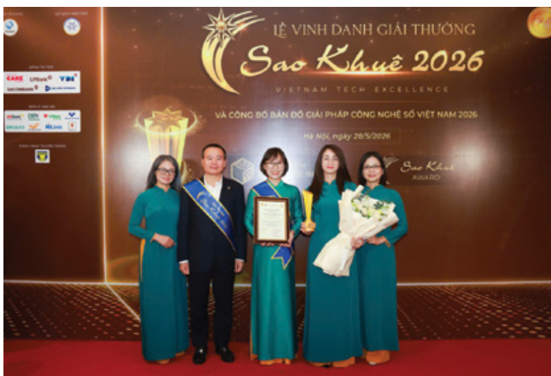
Đại diện Trung tâm thanh toán cùng các đơn vị tại BIDV vinh dự nhận giải thưởng Sao Khuê cho sản phẩm SWIFT SCORE

Cùng với xu hướng chuyển đổi số mạnh mẽ của ngành tài chính - ngân hàng, công tác nghiên cứu khoa học và sáng kiến cải tiến tại Trung tâm Thanh toán ngày càng khẳng định vai trò quan trọng trong việc nâng cao năng suất vận hành, phát triển sản phẩm dịch vụ và thúc đẩy đổi mới công nghệ.