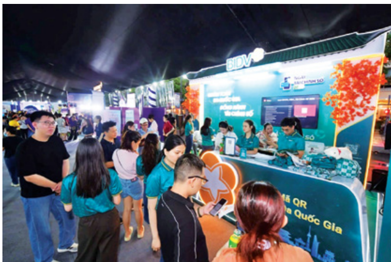
Gian hàng trải nghiệm của BIDV đón lượng khách hàng đông đảo

Với nhiều hoạt động trải nghiệm thực tế, tư vấn sản phẩm và chương trình tương tác hấp dẫn, gian hàng BIDV đã thu hút đông đảo khách tham quan trong suốt thời gian diễn ra sự kiện. Thông qua Ngày Tài chính số 2026, BIDV tiếp tục lan tỏa các giá trị của thanh toán thông minh, góp phần thúc đẩy tài chính số toàn diện và khẳng định vai trò tiên phong trong hành trình chuyển đổi số ngành ngân hàng. □