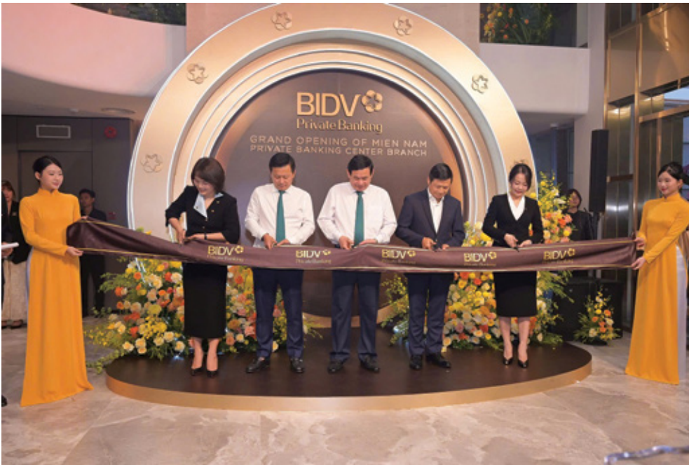
Ban lãnh đạo BIDV cắt băng khánh thành Chi nhánh

Đây là mô hình toàn diện nhất thị trường Việt Nam, đánh dấu bước phát triển mới trong chiến lược Private Banking chuẩn quốc tế của BIDV tại miền Nam