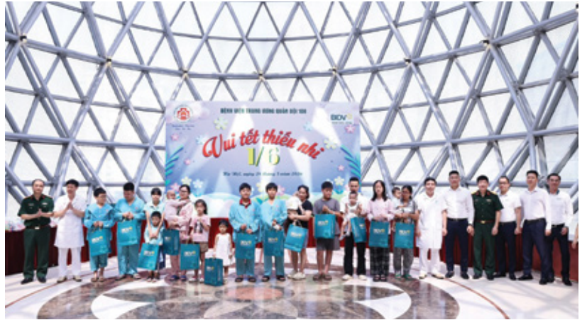
BIDV Thành Công đã phối hợp cùng bệnh viện Trung ương Quân đội 108 tổ chức chương trình "Vui tết thiếu nhi 2026" đầy xúc động ngay tại khuôn viên bệnh viện