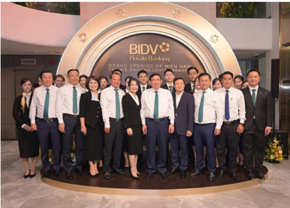
Đại diện Ban lãnh đạo BIDV và Chi nhánh chụp ảnh lưu niệm

Định hướng này được kiên trì triển khai qua từng năm: từ Trung tâm Khách hàng Cá nhân Cao cấp Hà Nội năm 2021, đến Thành phố Hồ Chí Minh năm 2024, và nay là Chi nhánh miền Nam. Cùng với việc hợp tác chiến lược với Edmond de Rothschild – định chế hàng đầu thế giới với hơn 250 năm kinh nghiệm trong lĩnh vực