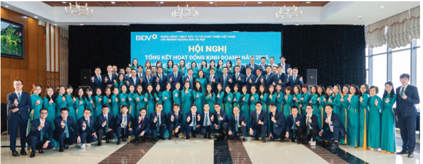
BIDV Chi nhánh Hoàng Mai Hà Nội quyết tâm là ngọn cờ đầu trong công cuộc số hóa

Mười năm – một chặng đường chưa dài so với lịch sử của hệ thống Ngân hàng TMCP Đầu tư và Phát triển Việt Nam, nhưng vừa đủ để một tập thể bền bỉ, kiên cường viết nên một câu chuyện chuyển mình đáng tự hào. Từ một chi nhánh non trẻ trên địa bàn huyện Thanh Trì, vượt qua đại dịch Covid-19 và nhiều giai đoạn thắt chặt tín dụng, BIDV Hoàng Mai Hà Nội hôm nay đã khẳng định vị thế của một đối tác tài chính tin cậy với các tập đoàn lớn, doanh nghiệp nhỏ và vừa cùng hơn 100.000 khách hàng cá nhân tại Thủ đô Hà Nội.