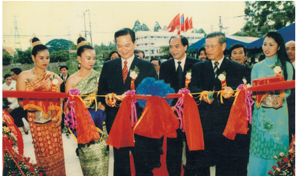
Phó Thủ tướng chính phủ Việt Nam Nguyễn Tấn Dũng và Phó thủ tướng Chính phủ Lào Somsavath Lengsavad cắt băng khai trương Ngân hàng liên doanh Lào - Việt tháng 6-1999