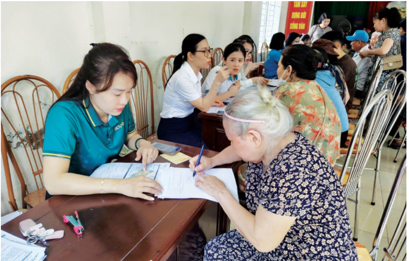
Gần 3.000 tài khoản được mở mới và trên hết là hàng nghìn nụ cười của người dân khi lần đầu tiên tiếp cận với những tiện ích của ngân hàng số

"Mỗi tài khoản được mở không chỉ là một giao dịch ngân hàng, mà còn là một nhịp cầu đưa chính sách đến gần hơn với người dân." Tháng Sáu năm 2026, khi những đợt nắng nóng gay gắt bao trùm khắp các miền quê Thanh Hóa, cũng là lúc một chiến dịch đặc biệt được triển khai với tinh thần khẩn trương, quyết liệt và đầy trách nhiệm.