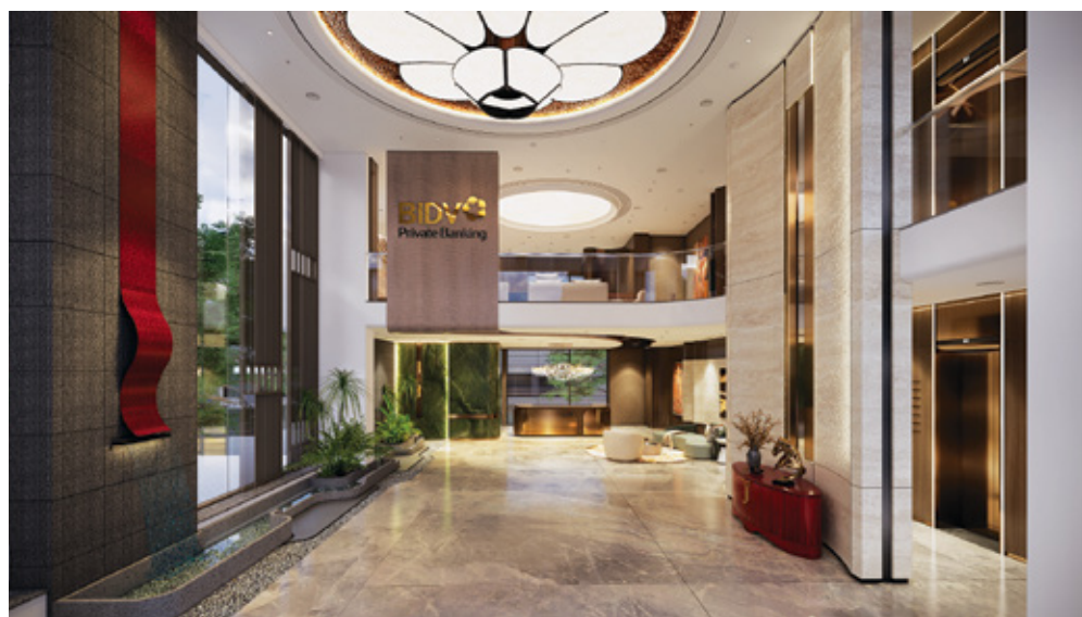
Biểu tượng hoa mai vàng nổi bật tại sảnh đón khách Chi nhánh Trung tâm Khách hàng cá nhân cao cấp miền Nam

“Với BIDV, Private Banking không đơn thuần là một phân khúc khách hàng, mà là cam kết về