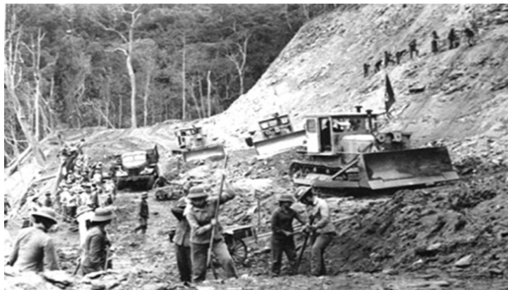
Các tuyến đường ra tiền tuyến mở ra từ đồng vốn Ngân hàng Kiến thiết cấp phát - 1966

Ngân hàng Kiến thiết Việt Nam được thành lập ngày 26 tháng 4 năm 1957 - chỉ với 200 cán bộ thuộc 11 chi nhánh, bài vở nghiệp vụ phải mượn từ Liên Xô và Trung Quốc, văn