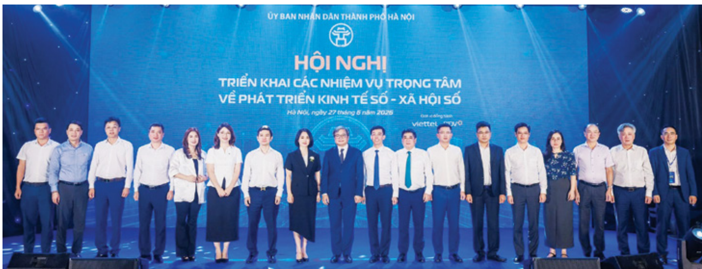
BIDV cam kết đồng hành cùng TP. Hà Nội thúc đẩy kinh tế số và xã hội số

xã hội với quy mô dự kiến từ 150 nghìn đến 200 nghìn tỷ đồng, tập trung toàn lực tài trợ cho các công trình chiến lược của Thành phố. Ngành ngân hàng sẵn sàng đóng vai trò đầu mối thu xếp, cấu trúc dòng vốn và kết nối các dòng tài chính quốc tế để tối ưu hóa chi phí nguồn vốn cho Hà Nội.