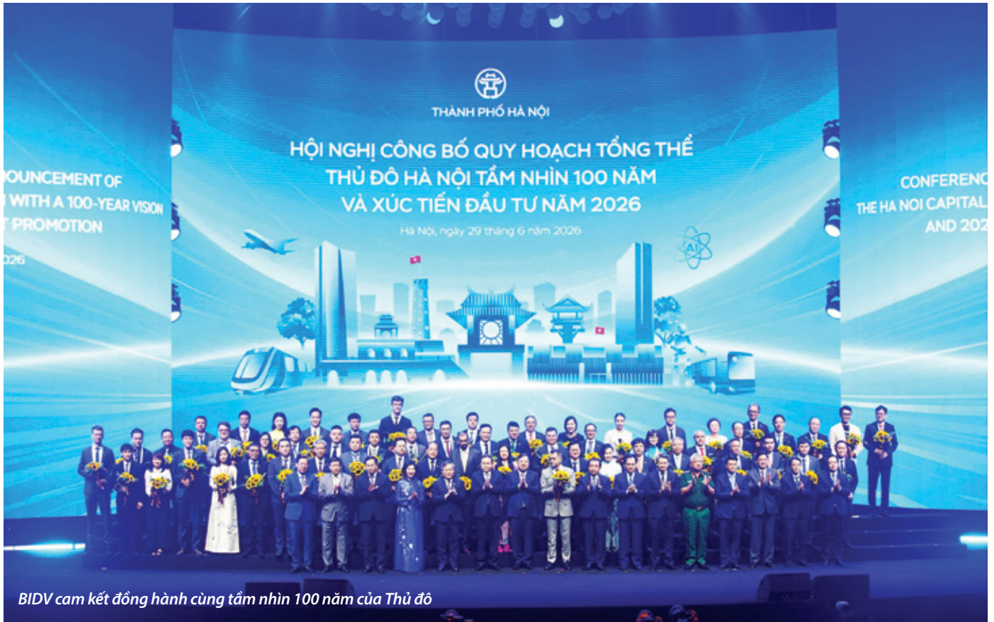
BIDV cam kết đồng hành cùng tầm nhìn 100 năm của Thủ đô