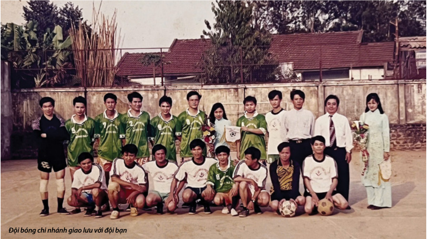
Đội bóng chi nhánh giao lưu với đội bạn