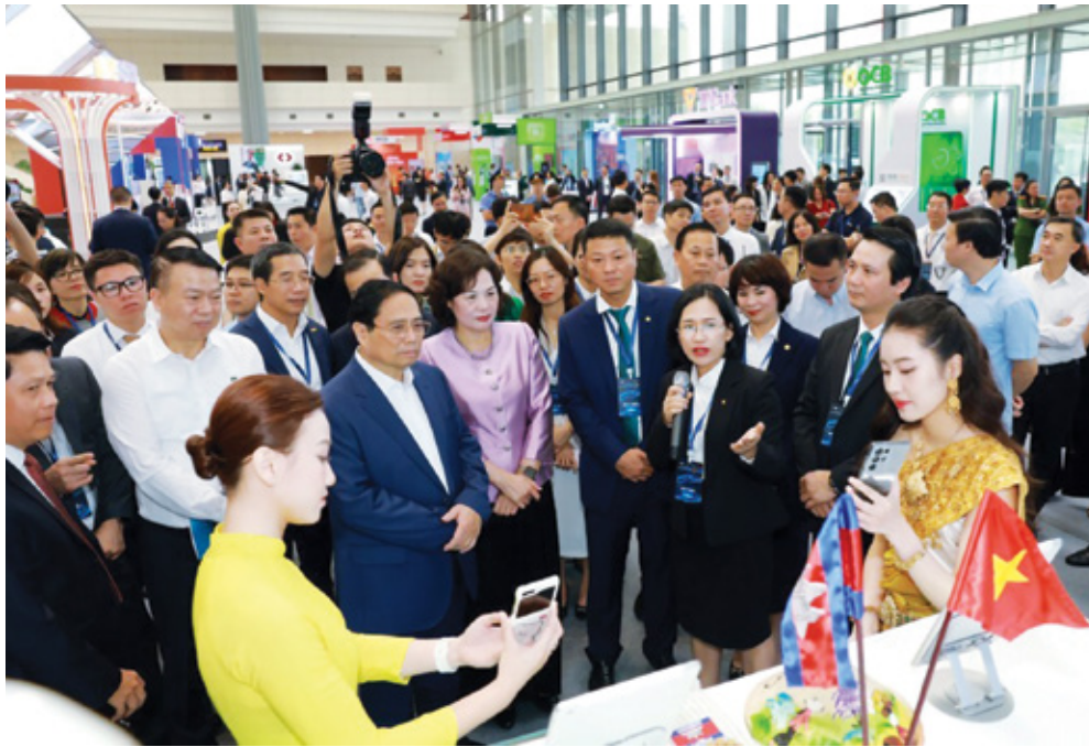
Lãnh đạo Chính phủ, Bộ ngành nghe giới thiệu về “Dịch vụ thanh toán QR xuyên biên giới” của BIDV

Trong dòng chảy mạnh mẽ của cuộc cách mạng công nghiệp lần thứ tư, khoa học công nghệ, đổi mới sáng tạo và chuyển đổi số đã trở thành động lực chủ yếu cho sự phát triển của mỗi quốc gia. Đảng và Nhà nước ta đã xác định chuyển đổi số là nhiệm vụ chiến lược, là ưu tiên hàng đầu trong đầu tư phát triển.