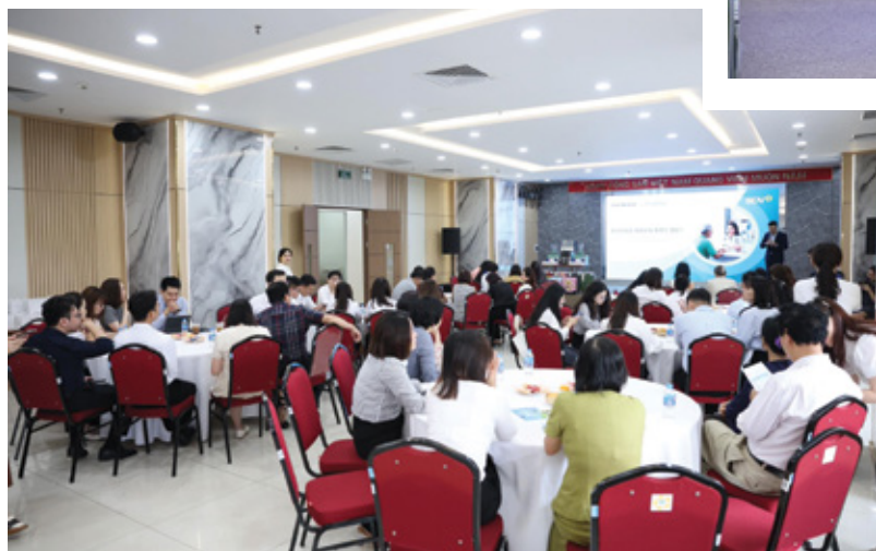
Workshop “Đột quy - Nhận biết sớm, hành động trong giờ vàng” được tổ chức tại Hà Nội

Chương trình được triển khai theo hai lớp chuyên đề dành cho Chủ tịch, Phó Chủ tịch, Ủy viên Ban Chấp hành và cán bộ công đoàn cơ sở, với hình thức trực tiếp kết hợp trực tuyến, thu hút sự tham gia của đông đảo cán bộ công đoàn trong toàn hệ thống.