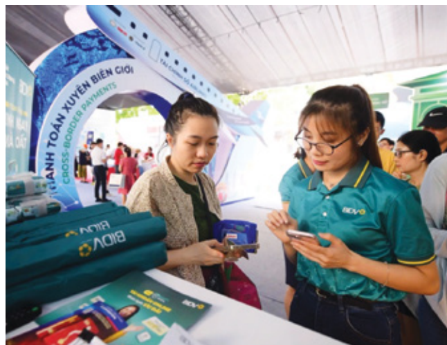
Khách tham quan được hỗ trợ mở tài khoản BIDV ngay tại gian hàng trải nghiệm

phù hợp với từng nhóm khách hàng và mở rộng khả năng tiếp cận dịch vụ tài chính đối với người dân và doanh nghiệp.