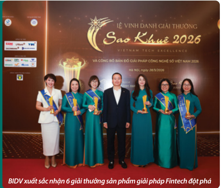
BIDV xuất sắc nhận 6 giải thưởng sản phẩm giải pháp Fintech đột phá

Giải thưởng Sao Khuê 2026 đánh dấu bước chuyển mình toàn diện, tiếp tục vai trò tôn vinh các sản phẩm, dịch vụ và giải pháp công nghệ số xuất sắc. Sao Khuê 2026 cũng lần đầu tiên được triển khai theo mô hình, thể hệ mới với kiến trúc và phương pháp luận đánh giá hoàn toàn mới, hướng tới chuẩn hóa nền công nghệ số Việt Nam theo tư duy quốc tế. Đi kèm với một hệ thống phân loại và định vị toàn diện, nhằm phản ánh chính xác quy mô triển khai, năng lực công nghệ, khả năng thương mại hóa và tiềm năng phát triển của từng giải pháp trong hệ sinh thái số Việt Nam.