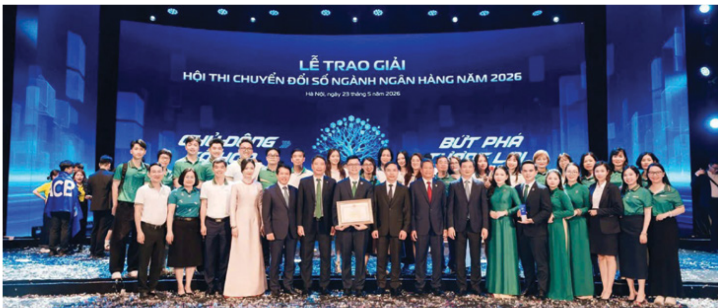
BIDV đạt giải Nhì chung cuộc hội thi “Chuyển đổi số ngành Ngân hàng 2026”

Ngân hàng Nhà nước đánh giá cao về năng lực làm chủ công nghệ. Thứ hai, số hóa toàn diện các hoạt động nội bộ và dịch vụ khách hàng. Thứ ba, phát triển nguồn nhân lực số. Hiện BIDV có 1.000 nhân sự công nghệ, dự kiến năm 2025 tăng lên 1.400 nhân sự, cho thấy sự đầu tư nghiêm túc cho nguồn lực con người trong thời đại số.