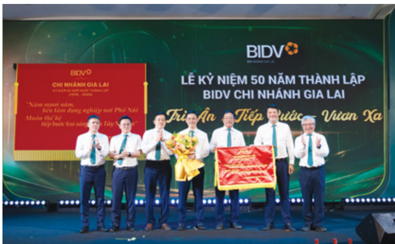
BIDV Gia Lai vinh dự nhận khẩu hiệu Ban lãnh đạo trao tặng: “Năm mươi năm bền tâm dựng nghiệp nơi Phố Núi – Muôn thế hệ tiếp bước tòa sáng miền Tây Nguyên” tại lễ kỷ niệm 50 năm thành lập

Đó chính là khát vọng của thế hệ cán bộ BIDV Gia Lai hiện tại, khát vọng được tiếp nối từ 50 năm lịch sử và sẽ tiếp tục kiến tạo tương lai bằng niềm tin, bản lĩnh và trách nhiệm trong những thập niên rạng rỡ phía trước.