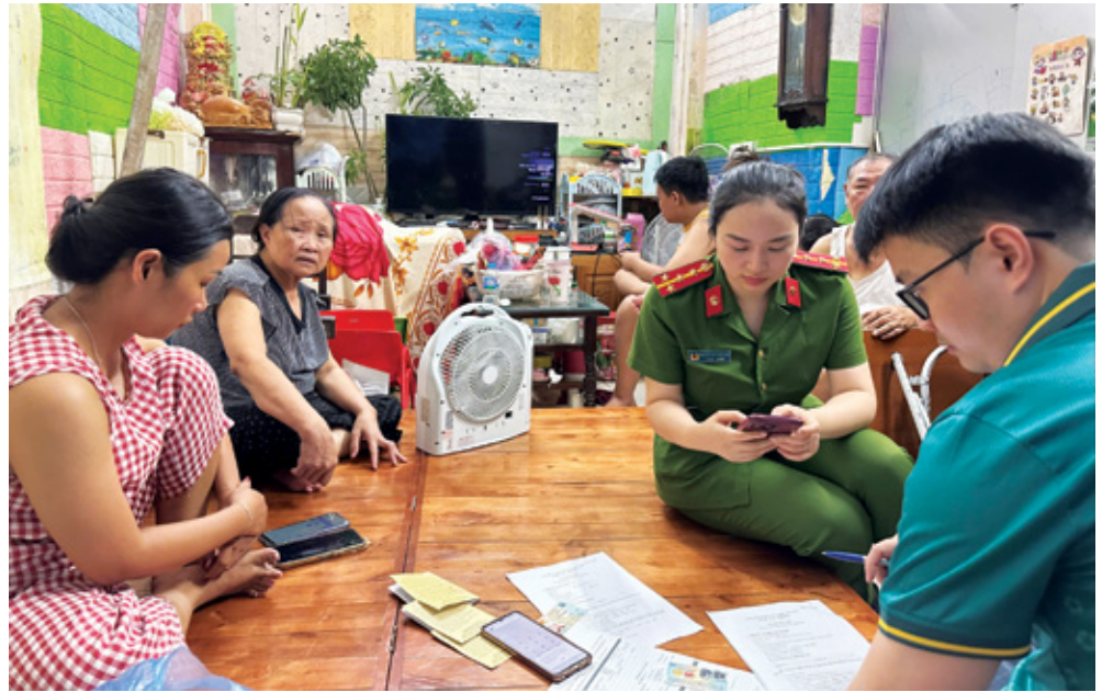
Những cán bộ BIDV Lam Sơn miệt mài trên các tuyến đường, tận tụy hướng dẫn từng người dân, kiên nhẫn giải thích từng thao tác và không quản ngại khó khăn để đưa dịch vụ ngân hàng đến gần hơn với cộng đồng

Điều làm nên thành công của chiến dịch không chỉ là sự chuẩn bị kỹ lưỡng về chuyên môn nghiệp vụ mà còn là tinh thần trách nhiệm, nhiệt tình của mỗi cán bộ tham gia. Trong những ngày cao điểm,